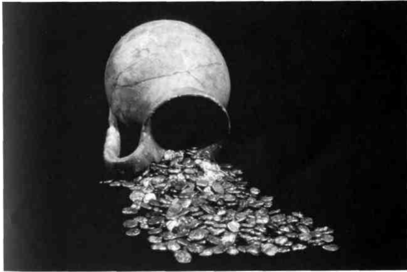
Fig. 2 Tesoro procedente de las excavaciones de Empúries (Girona), depositado en el MNAC - Gabinet Numismàtic de Catalunya.