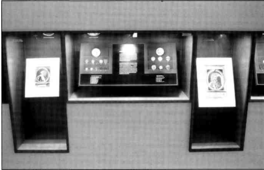
Fig. 4 Detalle de la exposición «La imagen del poder en la moneda», organizada por el MNAC - Gabinet Numismàtic de Catalunya en 1998