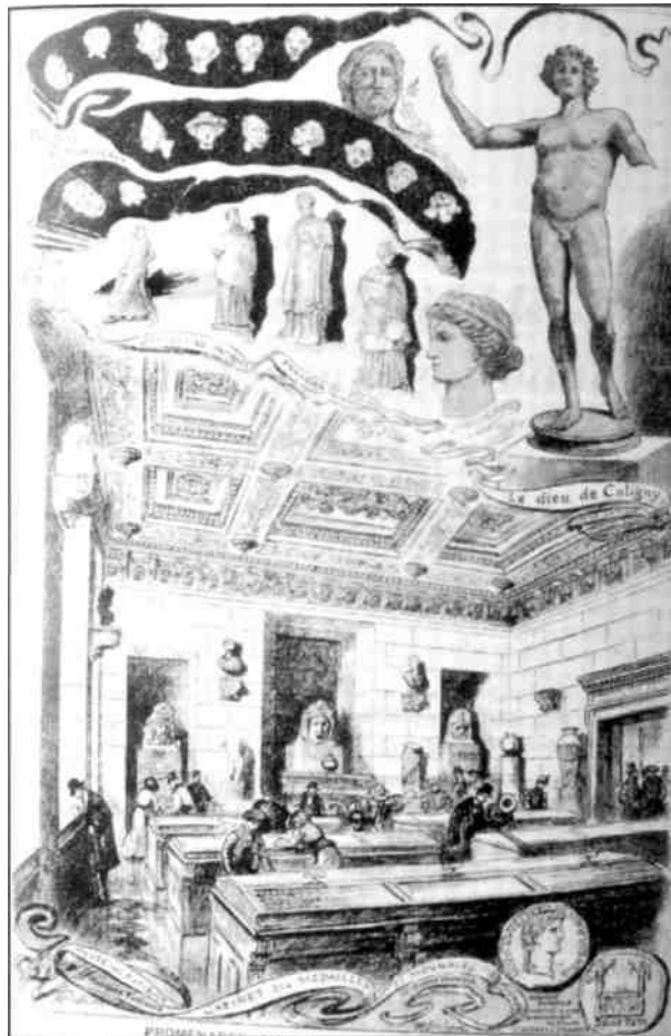
Fig. 3 El Médaillier del Museo de Bellas Artes de Li3n en 1903, seg3n un grabado del Progr3s illustr3